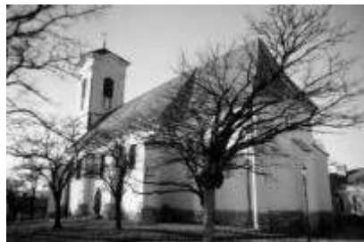
9. ábra Szentendre, római katolikus templom

A kölcsönhatást a másik irányban is megtaláljuk. Szentendre római katolikus templomának tornyát [9.ábra] óranyílásos főpárkány díszíti, ami a környezetében levő szerb templomok tipikus formaképzése.