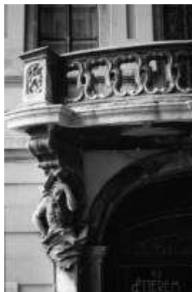
6. ábra Budapest, Százéves étterem, erkély mellvédje

Mayerhoffer azon építési körhöz tartozik, mely az osztrák hatású barokkot váltja fel az 1830-as években. A pesti belvárosi templom (és kapuja) még osztrák hatású, azonban sajátos magyar jelleget mutat már a pesti polgári barokk jegyében Mayerhoffer Egyetem-temploma és a Száz-éves-étterem. [6.ábra]