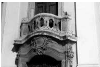
5. ábra Szentendre, "Blagovestenszka"-templom, kórusablak mellvédje

Mayerhoffer azon építési körhöz tartozik, mely az osztrák hatású barokkot váltja fel az 1830-as években. A pesti belvárosi templom (és kapuja) még osztrák hatású, azonban sajátos magyar jelleget mutat már a pesti polgári barokk jegyében Mayerhoffer Egyetem-temploma és a Száz-éves-étterem. [6.ábra]