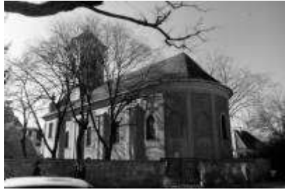
3. ábra Szentendre, "Pozsarevacska"-templom (1759)

A XVIII. század vége felé sajátos, bizánci liturgiához alkalmazkodó differenciálódást figyelhetünk meg. Az építészeti keretek átalakulását Szentendre "Tyiprovacska"-templománál nézzük meg. [4.ábra] A bizánci liturgiában jelentős szerepet kapnak az énekesek. Szentély előtt elhelyezett padjaik külön teret kapnak, conchás térbővületet alkotva a templom tömegében. Ez a továbbiakban a szerb templomok jellemő tömegformája lesz. A tornyot pedig ekkor már a templomhajó tömegével együtt építik.