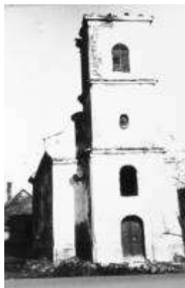
10. ábra Bátaszék, szerb ortodox templom, lebontva 1958-ban

A XX. század közepére a háborúk dúlásai és a politikai érdekharok következtében a magyarországi szerb nemzetiség lélekszámban igen megfogyatkozott. A templomok elhagyatottá váltak. Megszűnt az a személyes érzelmi háttér, ami egy ortodox templom létét áthatja. A budai szerb püspökség anyagilag nem tudta állni e templomok fenntartását, így a II. világháborúban erősen megrongálódott épületeket az 1950-60-as években lebontották. [10.ábra] Egy templom lebontása nem csak tárgyi, hanem eszmei-emberi értékeink pusztulását is jelenti, amire tudományos kutatások által is fel kell hívni a figyelmet.