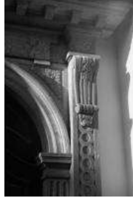
7. ábra Szentendre, "Püspöki"-templom északi kapuja