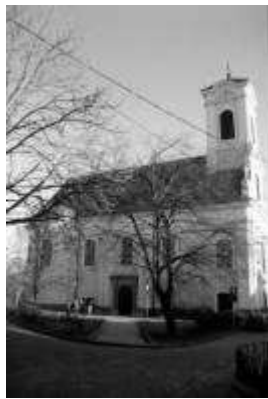
4. ábra Szentendre, "Tyiprovacska"-templom (1792)

A XVIII. század vége felé sajátos, bizánci liturgiához alkalmazkodó differenciálódást figyelhetünk meg. Az építészeti keretek átalakulását Szentendre "Tyiprovacska"-templománál nézzük meg. [4.ábra] A bizánci liturgiában jelentős szerepet kapnak az énekesek. Szentély előtt elhelyezett padjaik külön teret kapnak, conchás térbővületet alkotva a templom tömegében. Ez a továbbiakban a szerb templomok jellemő tömegformája lesz. A tornyot pedig ekkor már a templomhajó tömegével együtt építik.